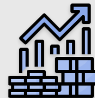
Condiciones de vivienda