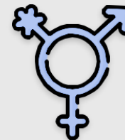
Enfoque de género